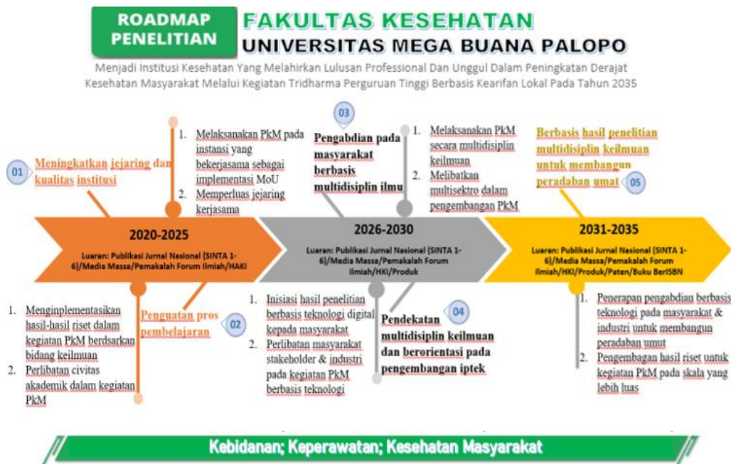
Gambar 2.2 Roadmap PkM Fakultas Kesehatan UMBP