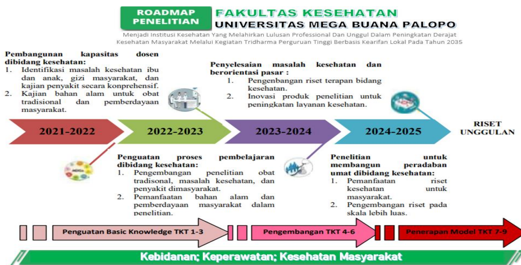
Gambar 2.1 Roadmap Penelitian FKes UMBP

Landasan pengembangan penelitian merupakan visi misi Universitas Mega Buana Palopo, visi misi Lembaga Penelitian dan Pengabdian Masyarakat (LPPM) serta analisis kinerja penelitian. Roadmap penelitian selama kurun waktu 2020-2035, dimana untuk periode tahun 2020-2025 merupakan tahap penguatan penelitian yaitu penelitian dasar dan penelitian terapan yang tertuang dalam Renstra Penelitian yang dibentuk melalui berbagai kebijakan-kebijakan yang disusun oleh Fakultas Kesehatan Universitas Mega Buana Palopo. Adapun roadmap penelitian Fakultas Kesehatan Universitas Mega Buana Palopo dijelaskan pada gambar 2.1 berikut: